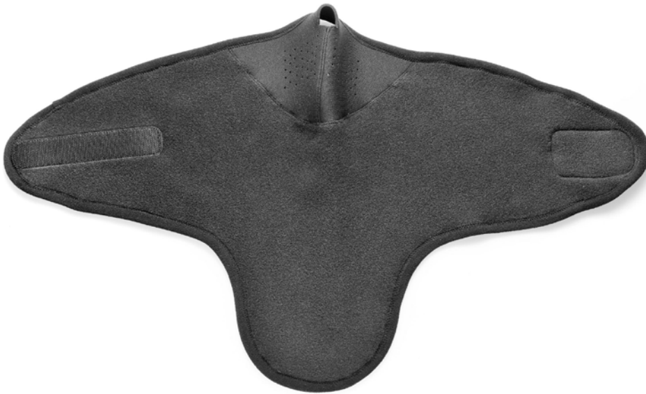
Abbildung 2: Schnittteil Fleece für den Halsbereich