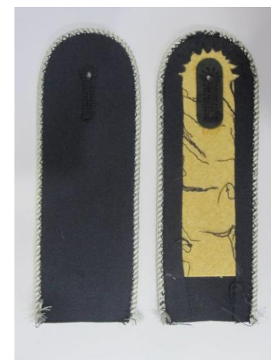
Bsp. Ausführung Nr.4: