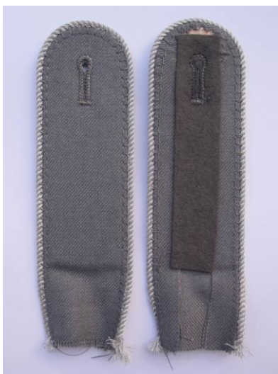
Bsp. Ausführung Nr.2: