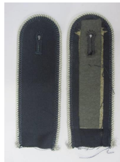
Bsp. Ausführung Nr.3:

SKLP Luftwaffe, Uniformjacke Perlgabardine