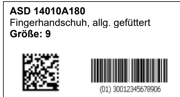
Beispiel: Artikeletikett mit GS1-Barcode und GS1 DataMatrix

Jeder an die BwBM gelieferte Artikel muss mit einem GS1-128 und dem GS1 DataMatrix ausgestattet sein.